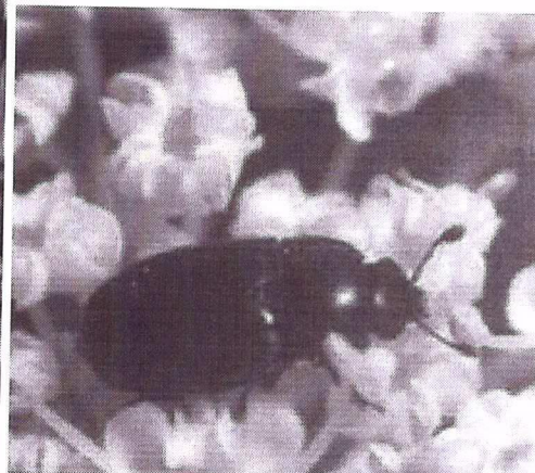
gandacul lucios al rapitei

Boli : putregaiul alb ( Botrytis cinerea ),putregaiul negru ( Phoma l. ), alternarioza ( Alternaria b. )