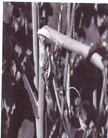
putregaiul alb al tulpinilor la rapita