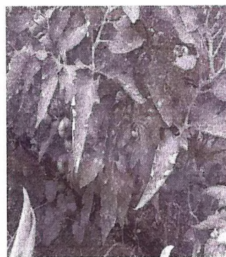
patarea cafeinie la tomate

Atentie! Musculita alba de sera s-a raspandit si in culturile din camp deschis.