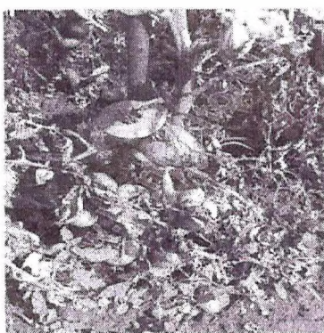
mana la tomate